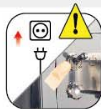
連接電源插頭，開啟