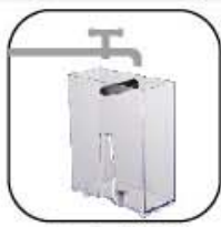
向水箱注入飲用水